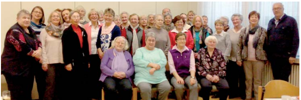
Ehemalige und derzeitige Mitglieder im Ökumenischen Besuchsdienst Zoar