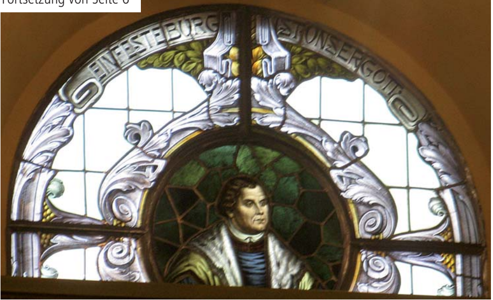
Jugendstilfenster in der Eimsheimer Kirche; zuoberst Spruchband mit dem Titelvers des Psalmenlieds "Ein feste Burg"

Die folgende Zwangspause auf der Wartburg galt dem Ziel, ihn aus der Öffentlichkeit herauszunehmen und Zeit zu gewinnen. Mit Untätigkeit hatte das natürlich nichts zu tun. Das Ziel einer verständlichen Bibelübersetzung nahm Luther erstmals in dieser Phase in Angriff. Bei allen Ungenauigkeiten: Der ansprechende Text rund um die „Fleischtöpfe“, „Lückenbüßer“ und „Denkzettel“ prägt die deutsche Sprache bis heute. Luthers Medienpädagogik schloss auch die Musik und die Bildkultur ein. Über den Dichter Luther gibt das Gesangbuch vielseitig Aufschluss. Bei der Bilderfrage lehnte Luther jede Form von Bildersturm ab und befürwortete das Prinzip der „Augenbibel“: Erklärende oder erinnernde Bilder waren wertzuschätzen, Andachtsbilder durften dagegen