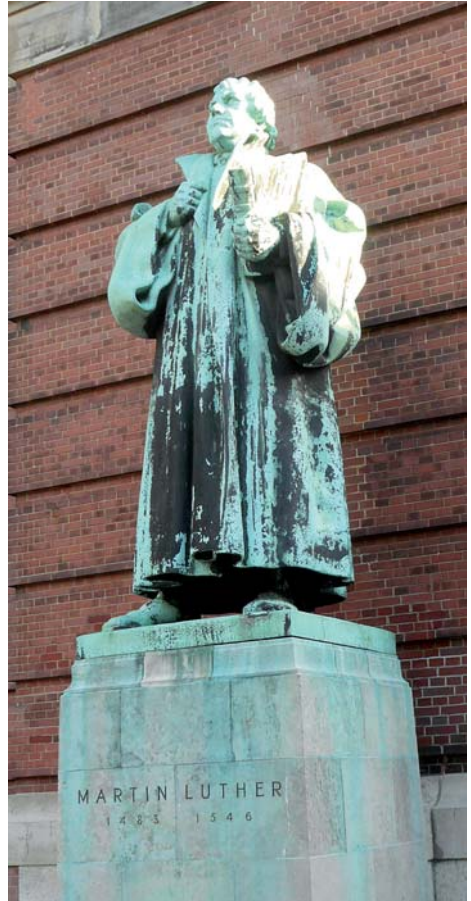
Luther mit reichlich Patina; Hauptkirche St. Michael, Hamburg

Es gibt Phasen in Luthers Leben, in denen er ab einem bestimmten Puls über Juden zu schimpfen schien. Mitten in einer Abhandlung, ohne inhaltlich-argumentativen Gewinn, nur zum Abreagieren. Nach den antisemitischen Verbrechen des 20. Jahrhunderts unmöglich, aber im 16. Jahrhundert gang und gäbe: Er hat es nicht erfunden und blieb darin auch nicht der einzige Reformator. Dass ihm zu Zeiten der NS-Herrschaft Sonderausgaben mit Sammlungen judenfeindlicher Lutherzitate gewidmet wurden, beruht aber auf einem unzulässigen Anspruch auf Vereinnahmung (keinem „Missverständnis“): Nach Luther sollte die jüdische Religion durch Mission und Pression beseitigt werden, während der nationalsozialistische Antisemitismus nach einer pseudobiologischen Theorie einen Massenmord an Juden (und anderen) samt deren christlichen Nachkommen plante. In der Wissenschaft war