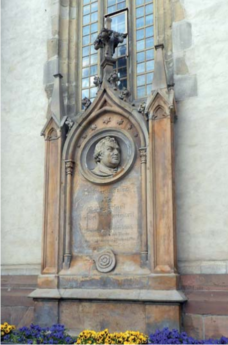
Erinnerungstafel an der Marktkirche, Halle

er habe einen perfekten Kompromiss für alle Evangelischen einschließlich Luther gefunden, erklärten ihm seine Kollegen, dass er sich das nur einbilde, weil er kein Deutsch könne.