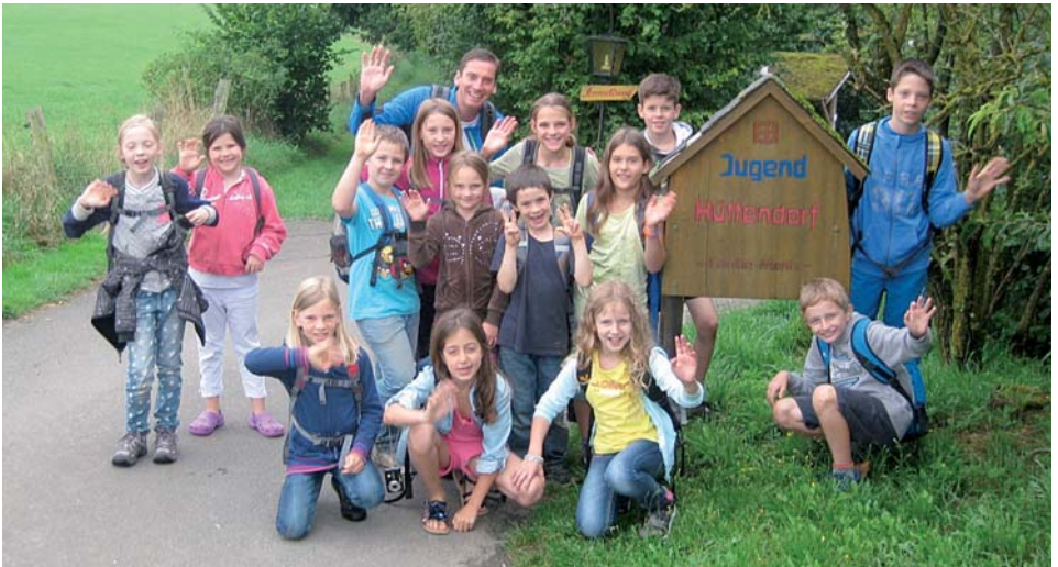
Vor der Wanderung zur Oberburg in Manderscheid (2014)

Leider konnten für 2017 für den geplanten