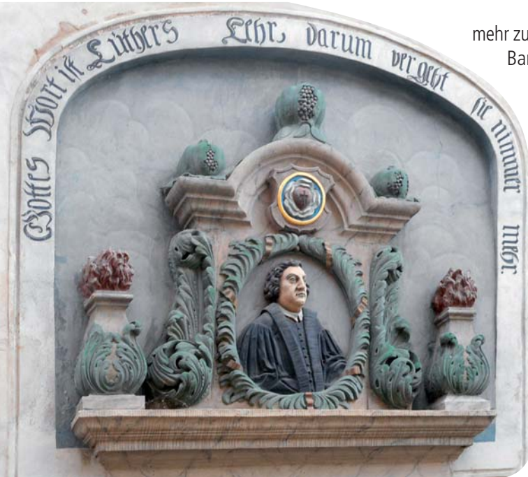
Halbplastik am Geburtshaus in Eisleben; über dem Kopf die "Lutherrose" als Wappen

längst nicht zum Eklat führen müssen. Erst eine zweijährige Phase der Skandalisierung machten den Bruch offenkundig: Eine unentschiedene Disputation in Heidelberg, ein Verhör vor einem päpstlichen Legaten in Augsburg, wo Luther sich nur durch Flucht zu helfen wusste, zuletzt eine denkwürdige Auseinandersetzung mit Eck in Leipzig sorgten für die unbestreitbare Unvereinbarkeit des kirchlichen Machtanspruchs und Luthers Denken. Wenngleich er in Leipzig gewiss verloren hatte, machte er doch klar, dass er Papst und Konzilien für menschlich fehlbar hielt. Damit konnte sein Denken nicht mehr in bisher gültige Wahrheiten des christlichen Glaubens eingeordnet werden. War diese Frage ausgesprochen, ließ sie sich nicht