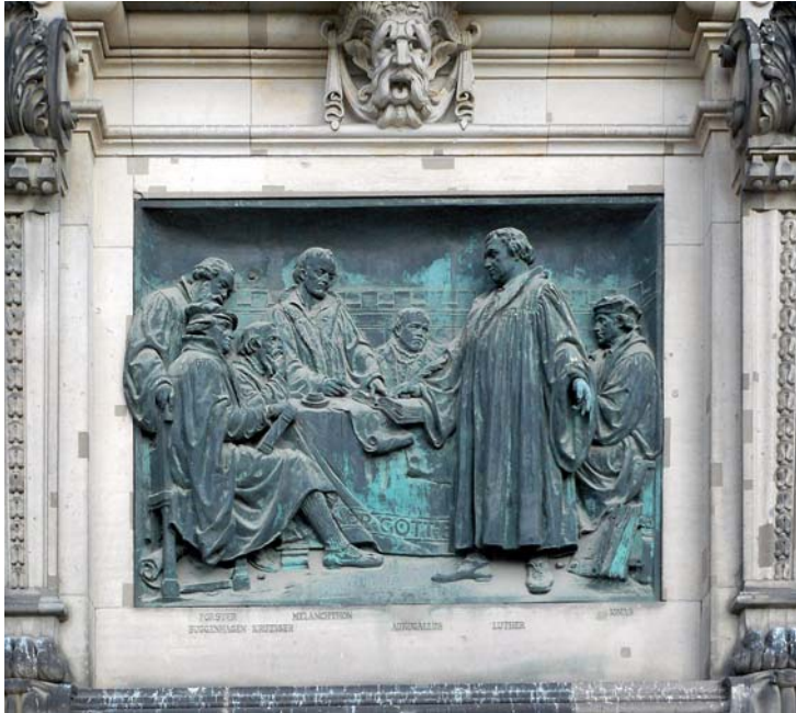
Luther im Kreise seiner Mitarbeiter; Reliefplatte am Berliner Dom

Der Bruch mit seiner Kirche ist dem jungen Luther nicht leicht gefallen. Nachdem der Jura-Student während eines Gewitters in Todesangst gelobt hatte, er wolle Mönch werden, nahm er sich dieser Lebensaufgabe überzeugend an: Augustiner-Barfüßer als Bettelorden forderten Armut, Keuschheit und Gehorsam, so dass er eigentlich keine Aussicht mehr hatte, noch einmal in der Öff-