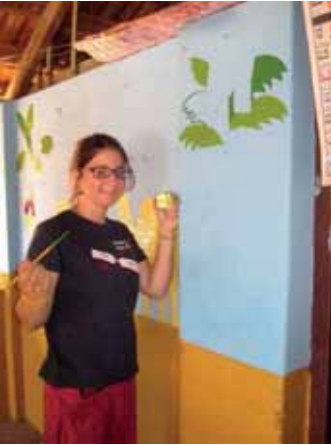
Neugestaltung einer Schule

ren Umgebung in das neue Schuljahr starten können. 2 Monate vor Ende meines Aufenthalts, kann ich auf eine turbulenten