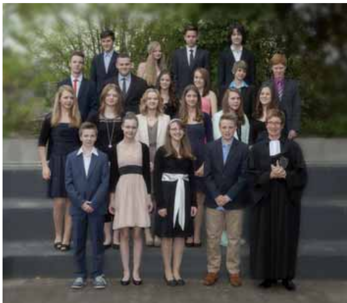
Der Konfirmandenjahrgang 2012 / 2013