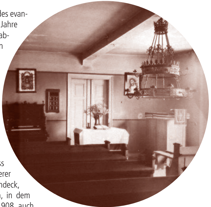
Betsaal in der Burg Windeck frühes 20. Jhd.

Das Ende des Zweiten Weltkriegs brachte allerdings aufgrund der Tatsache, dass die Vertreibung deutscher Minderheiten überwiegend evangelische Gebiete betraf, auch ein massives Wachstum der Kirchengemeinde, die damals noch als Filial von Wackernheim versehen wurde. Die neuformierte Landeskirche musste zwar nicht kurzfristig reagieren, aber mit dem allgemeinen Bevölkerungswachstum im Rhein-Main-Gebiet nahm die Planung eines Kirchenbaus wieder Gestalt an.